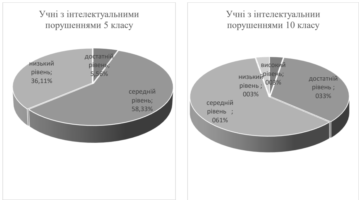
Рис. 1. Порівняльний кількісний аналіз рівня сформованості соціально-побутових навичок у старшокласників з інтелектуальними порушеннями за усіма компонентами та показниками (дані подано у %)

Результати аналізу відповідей вчителів, вихователів та батьків на запитання щодо рівня сформованості соціально-побутових навичок у старшокласників з інтелектуальними порушеннями були наступні: